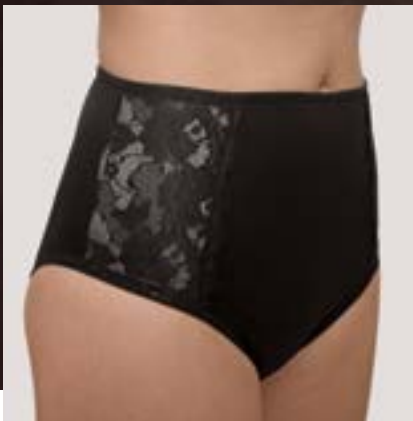
Mit Spitzeinsatz: Stoma-Slip mit hohem Bund von Life-Care-Products.