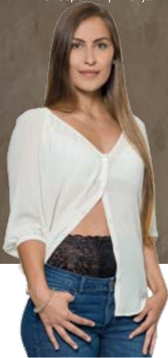
Elegant: Stomagürtel StomAktiv von Suprima.

Beutel und man sieht dadurch erst recht was“, findet die 25-Jährige, die nach einigen temporären Stomata aufgrund ihrer Morbus-Crohn-Erkrankung seit Ende 2015 ein permanentes Kolostoma hat. Sie zieht daher gerne ein eng anliegendes Top unter die Oberteile. „Dann ist der Beutel etwas versteckter und man sieht auch farblich nichts von ihm durch. Mein Stoma ist tatsächlich noch nie jemandem aufgefallen.“